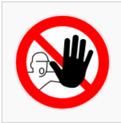
Zutritt für Unbefugte verboten